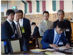
受付にて、少し緊張ぎみ？ 親睦活動委員会メンバー