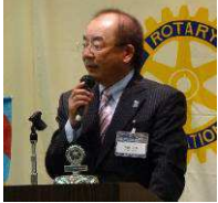
センターRC・小椋会長