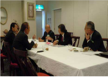
ガバナーとの会長・幹事懇談会