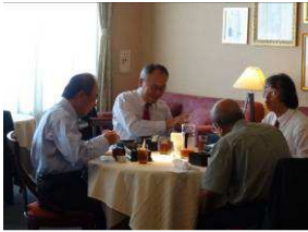
ガバナーを囲み 可児会長、小栗会長、小椋会長、波多野地区委員、各務地区委員、別室にて食事。