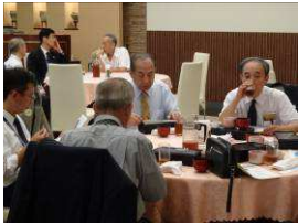
和やかな 例会前の昼食会場。