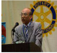
中津川RC・可児会長