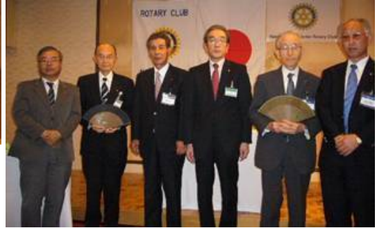
両クラブ会長より記念品の贈呈